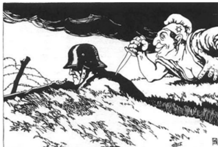
Figura 1: Ilustração de postal austríaco, 1919.

Disponível em https://pt.wikipedia.org/wiki/Lenda_da_punhalada_pelas_costas#/media/Ficheiro:Stab-in-the-back_postcard.jpg . Acesso em 11/09/2020