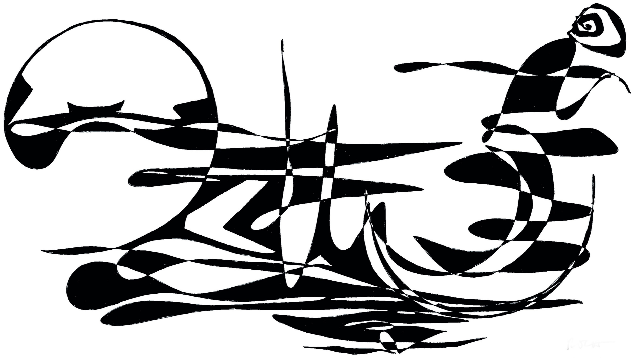
Desenho em tinta sobre cartolina - Pilar Roca